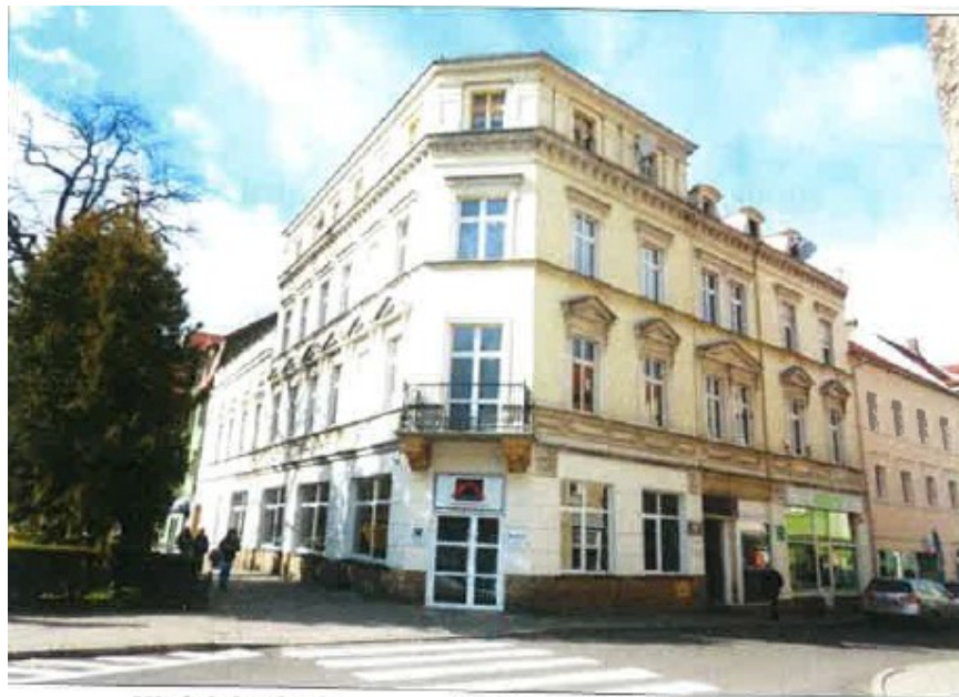
Widok budynku przy ulicy Brackiej 11 w Lubaniu.

na sprzedaż lokalu przeznaczonego na cele inne niż mieszkalne Nr L7, znajdującego się w budynku położonym w Lubaniu przy ul. Brackiej 11 wraz z oddaniem we współużytkowanie wieczyste ułamkowej części gruntu oznaczonego geodezyjnie jako działka nr 34/1, AM 4, Obręb III, , o powierzchni 275,00 m 2 ( księga wieczysta JG1L/00020836/5).