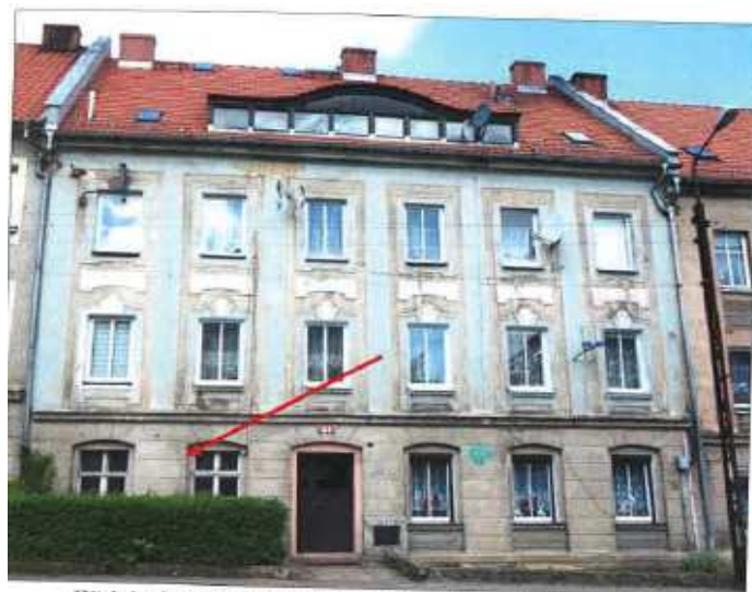
Widok elewacji frontowej – ul. Jarosława Dąbrowskiego.

na sprzedaż lokalu mieszkalnego Nr 1, znajdującego się w budynku położonym w Lubaniu przy ul. Jarosława Dąbrowskiego 24 wraz z udziałem we współwłasności nieruchomości gruntowej (działka nr 81, AM 5, Obręb V o powierzchni 150 m 2 , JG1L/00015872/1)